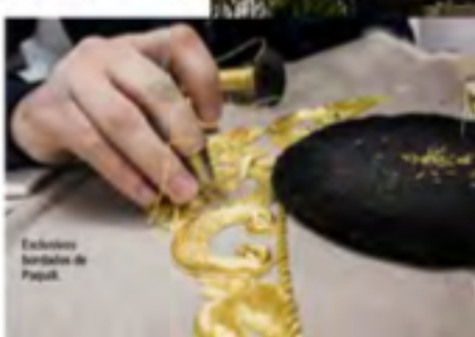
Exclusivos bordados de Pagui.