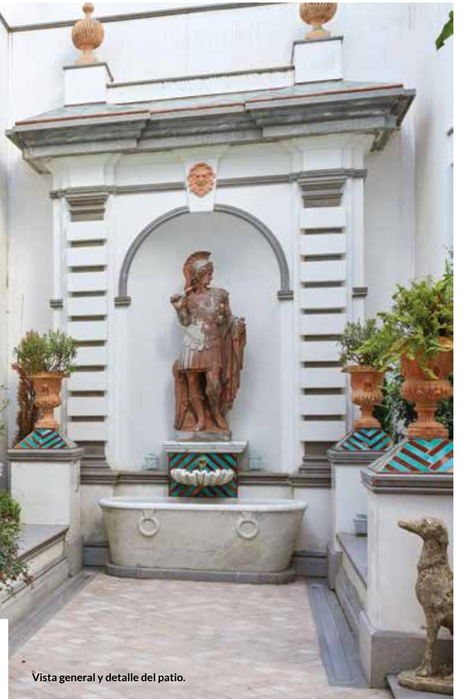
Vista general y detalle del patio.