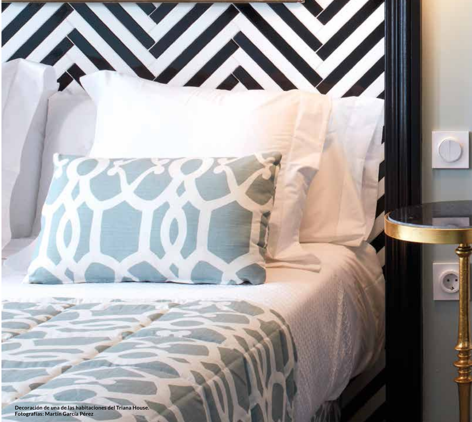
Decoración de una de las habitaciones del Triana House.

¿Qué guarda en su interior un interiorista? Suena como "el colmo de los colmos" pero en esta entrevista nos hemos propuesto desgranar todo el bagaje cultural y visual que ha ido almacenado este decorador en su camino hacia el éxito.