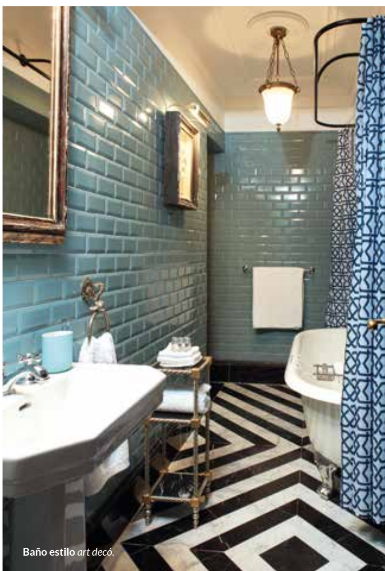
Baño estilo art decó .